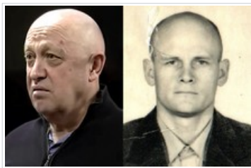
Jevgeni Prigozjin (links) en Dmitry Utkin (rechts)

zouden tot de doden bij de crash behoren.